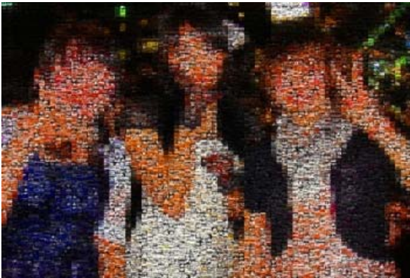
図 4 人物の写る低評価だった画像の例 (上)集合写真 (下)顔のアップ写真

また、人物の顔がつぶれているにも関わらず評価の高かった画像もあった。それは、人数や男女がある程度わかるくらいの撮影距離で、背景に写る物の輪郭がくっきりとしている場合であった。これは、代表写真の自動選出に利用できそうであると我々は考えた。