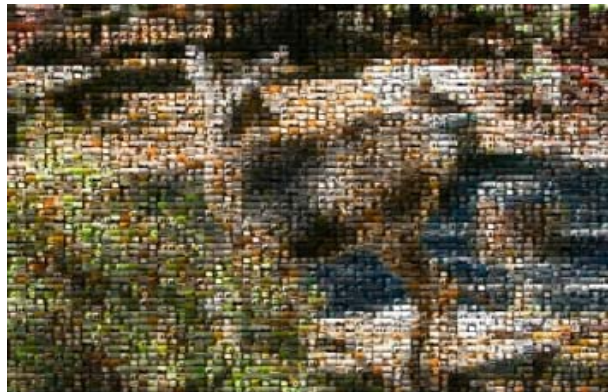
図 6 色差のある画像とない画像の例 (上)色差大きい画像 (下)色差の少ない画像