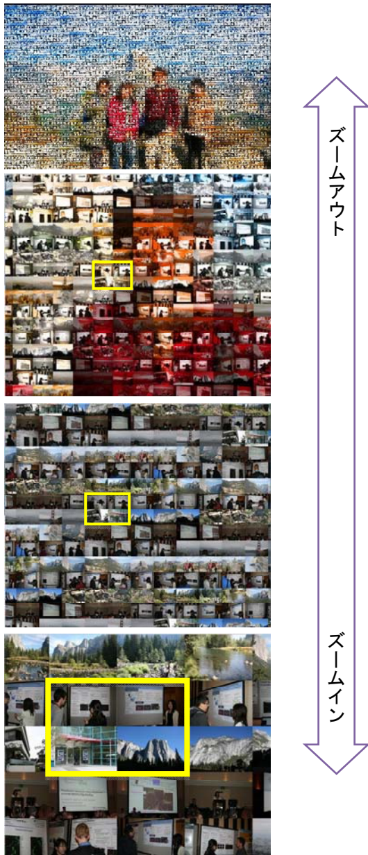
図 2 (上)本手法で生成したフォトモザイク (中上)一部を拡大したもの (中下)元画像に表示が切り替わった瞬間 (中下)元画像の拡大提示

用されている。この画像を一部、拡大表示したものを図 2(中上)に示す。これを見ると各々のブロックには建物や樹木が写っており、それらの色合いは実物とは全く異なるが、シルエットの形状からそれらが建物や樹木であることを認識可能である。このフォトモザイク風の画像を CAT に組み込んでズームアウト時の代表画像に用いると、図 2(中上)から図 2(中下)のようにズームインして CAT での表示階層が変わる際に、各々のブロックの色相だけが各々の画像のものに置き換わり、スムーズに図 2(下)のような各画像の表示に切り替わる。