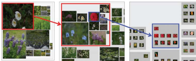
図 1 CAT のズーム操作による写真表示例 (左)(中)ズームアウト時は代表写真を表示 (右)ズームイン操作により各々の写真を表示

CAT には「ズーム操作に表示写真の切り替えが唐突に見える」という問題点があった。そこで CAT の代表写真部分に本研究で生成するフォトモザイクをはめ込むことで、フォトモザイクが有する「ズームアウトして見ると 1 枚の画像、ズームインして見ると個々の小さい画像」の効果によって、表示写真のスムーズな切り替えを可能にした。