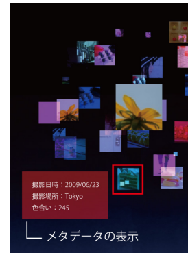
図 3. 写真メタデータの表示

我々の Phopper の実装では，以下のようなユーザインタフェースを設けている．まず3次元空間の移動には，フライトシミュレータに代表される既存の3次元CGソフトウェアと同様に，マウス操作によるズームイン，ズームアウト，平行移動の機能を設けた．さらに，花火が打ちあがっている最中に，ある写真をマウス選択すると，選択された写真のメタデータを表示する機能も設けた(図3)．