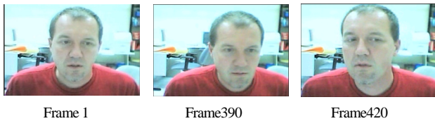
図1: 被験者 A の顔動画像

における運動物体のオプティカルフローを局所勾配法によって推定する手法である[8]。