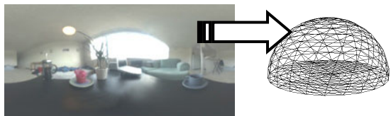
図3: Distant 画像(左)を半球(右)に射影する

図3に示すように, 本手法では Distant 画像を, 仮想物体や実物体を覆うような, 三角形メッシュに分割された半球に射影することで, 遠方光源の再現に使用する. このとき, Local 画像の各画素について, それぞれどの三角形に内包されるかを判定し, その画素の RGB 値を三角形の光エネルギー E_1 に加算する. この処理によって本手法は, 半球を構成する三角形の初期光エネルギーを決定する. さらに Local 画像からは, 近接光源の光情報を得る.